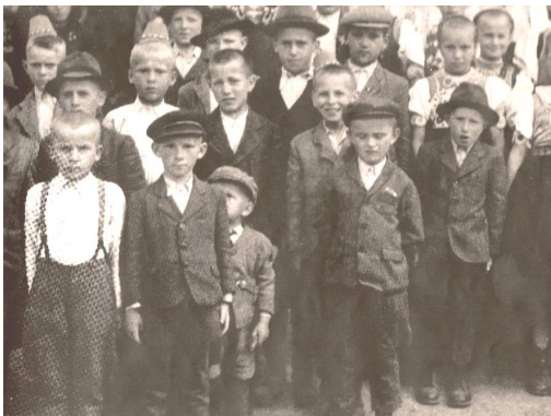
Výrez z fotky

to. Kto, povedzte, započul plač ročníkovej duše?! Bývalý skazonosný režim všetko vzal ľuďom. Čo už. Nik z dneška nepochopí tú premenu, vlastne tragédiu. Celé katolícke Slovensko sa už z toho nikdy nespamätá.