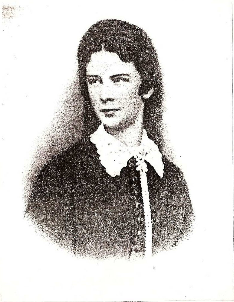
S/S/1 - podobizen z obdobia okolo roku 1863